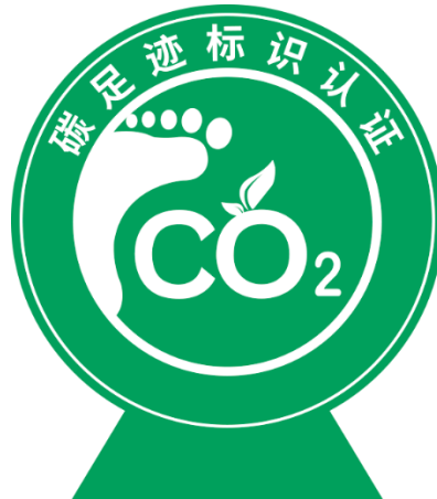
图 1 碳足迹标识认证标志

8.5 印制在获证产品标签、说明书或广告宣传材料上的碳足迹标识认证标志，可以按比例放大或缩小，但不应变形、变色。